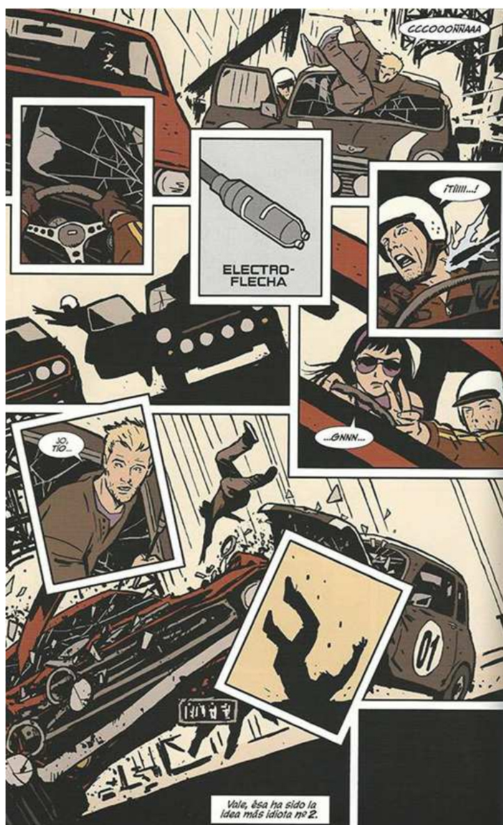
100% Marvel. Ojo de Halcón 1. Seis días en la vida de... (p. 60).

David Aja es el responsable del estilo visual de la serie. Del estilo con mayúsculas. No se trata solo del dibujo casi perfecto de Aja y de la increíble capacidad narrativa que despliega número tras número, sino del diseño con el que lo envuelve todo. Desde las portadas, opuestas a todo lo que uno puede encontrar en las librerías especializadas, siempre sobre fondo blanco y con diseños en base a tres colores que a su vez se repiten en los interiores gracias al excelente trabajo del colorista Matt