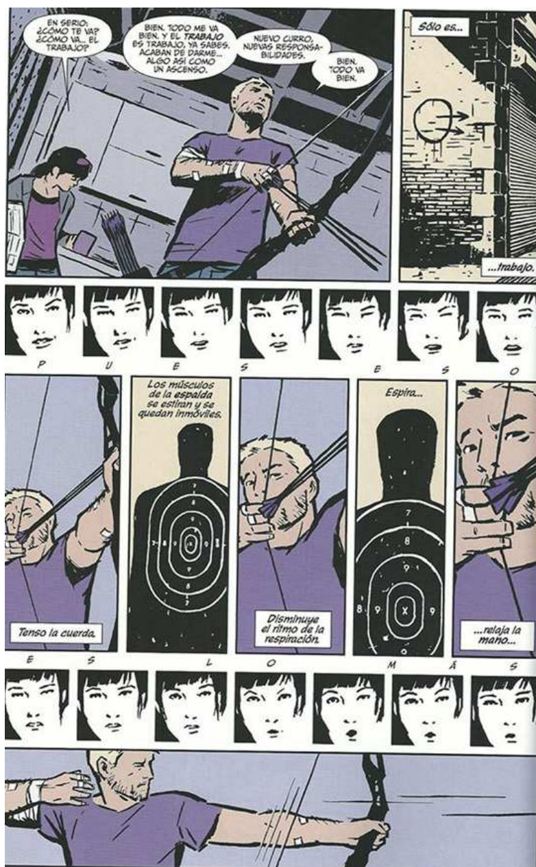
100% Marvel. Ojo de Halcón 1. Seis días en la vida de... (p. 27).

El trabajo de Aja a los lápices se ve potenciado por los guiones de Matt Fraction con quien ya entablara equipo en El inmortal Puño de Hierro . Fraction, a pesar de la etiqueta de guionista estrella que se le ha puesto, en parte debido a su inclusión en el grupo de Arquitectos de Marvel, es en el fondo un guionista de pequeñas series. Es en tebeos de personajes en los que mejor se mueve, alejándose de las grandes aventuras