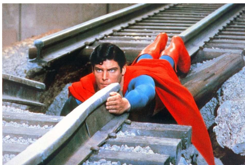
FIG. 4. Fotograma de Superman (Richard Donner, 1978).

Como adaptación, Superman era un producto contradictorio: si por un lado, la industria de Hollywood se mostraba como el camino para rodear al superhéroe de la fuerza cinemática que se intuía en los cómics, por otro lado parecía no tomárselo del todo en serio. El camino cada vez más humorístico que tomaron sus inmediatas continuaciones, llegando a rozar la autoparodia, no puede resultar más significativo.