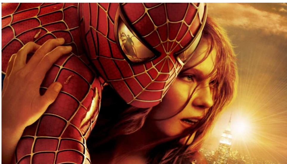
FIG. 1. Cartel de Spiderman 2 (Sam Raimi, 2004). Detalle.

como Barbarella (Roger Vadim, 1968), Adele y el misterio de la momia ( Les aventures extraordinaires d'Adèle Blanc-Sec , Luc Besson, 2010) o La gran aventura de Mortadelo y Filemón (Javier Fesser, 2003). Quizás en un futuro podamos acercarnos a esos territorios tan fascinantes o más que los del cine usamericano. Después de todo, el cómic es un lenguaje en perpetuo “continuará”.