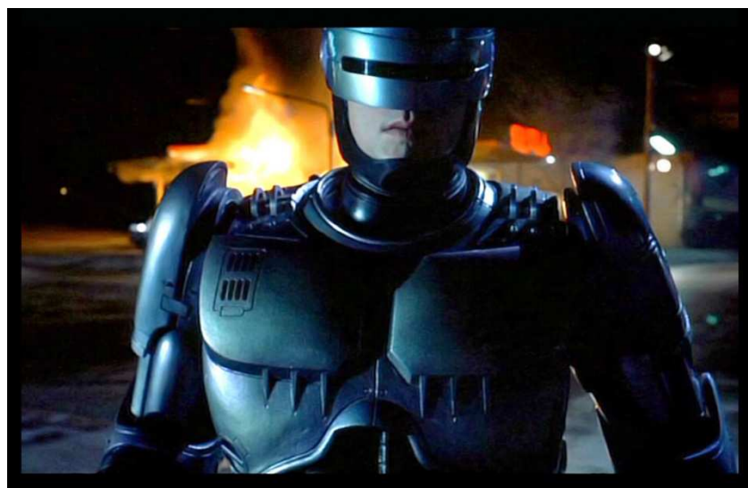
FIG. 6. Fotograma de Robocop (Paul Verhoeven, 1987).

Como indicábamos en el epígrafe anterior, tuvo que pasar más de una década para que una película basada en un cómic se convirtiera en un fenómeno mediático. Durante los años ochenta, el mundo del cómic visitó de manera puntual el mundo del cine y los resultados fueron, casi siempre, decepcionantes: Popeye (1980), de Robert Altman; Flash Gordon (1980), de Mike Hodges; Howard, un nuevo héroe ( Howard the Duck , 1986), producida por George Lucas y dirigida por Willard Huyck, fueron algunos de los intentos, pero ninguno repitió el éxito de la película de Superman . Podemos hallar una excepción que, a la vez, nos servirá de paradigma de la época: Conan, el bárbaro ( Conan the Barbarian , 1982), brillante adaptación por parte del controvertido John Milius del personaje creado por Robert E. Howard para las páginas de la más pura pulp fiction pero lanzado al reconocimiento masivo de la mano de la editorial Marvel y de artistas tan musculosos como el propio cimmerico como Barry Windsor Smith o John Buscema. Pero, antes que apropiación del universo de la sword and sorcery de los cómics, Conan, el bárbaro es una diáfana plasmación de la ideología de Milius, quien convierte al personaje en una representación primitiva del Superhombre de Nietzsche, una máquina de la Naturaleza, instintiva y primaria, enfrentada a la aparición de la Religión, medio catalizador de los miedos del hombre y manipuladora de conciencias.