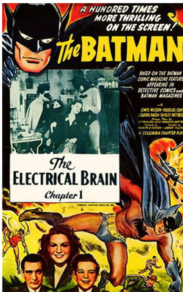
FIG. 2. Cartel del serial Batman (1943).

títulos que más han perdurado en la memoria son los que han tocado el género de manera tangencial: el aún reciente éxito de Smallville (2001-2011) le debía más al formato de la serie juvenil que al superheroico, ya que eran más importantes los diferentes conflictos sentimentales de los personajes que los provenientes de una amenaza externa. Un último ejemplo: la serie The Walking Dead (2010-), convertida en uno de los mayores fenómenos televisivos del momento, no ha tardado en apartarse del camino que emprendiese el cómic original en el que se basa, Los muertos vivientes , despertando las iras de los seguidores de este. Ante esto, queda una pregunta en el aire: ¿qué se busca a la hora de adaptar un cómic? E, inevitablemente, nos surge otra: ¿qué esperan ver en esa misma pantalla los lectores habituales del formato de salida?