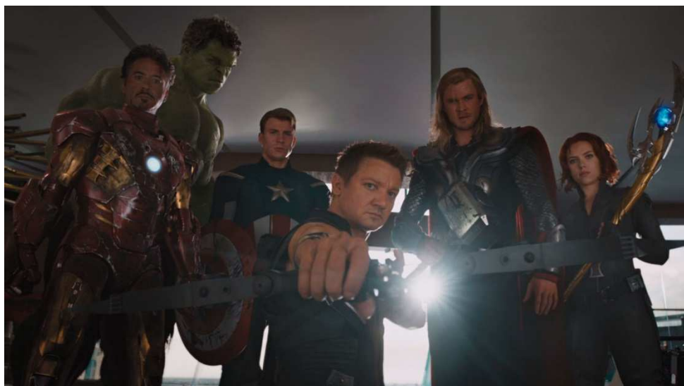
FIG. 12. Fotograma de Los Vengadores (Josh Whedon, 2012).

perder la compostura, demuestra que, en estos momentos, para el blockbuster el futuro parece pasar, sí o sí, por lo superheroico.