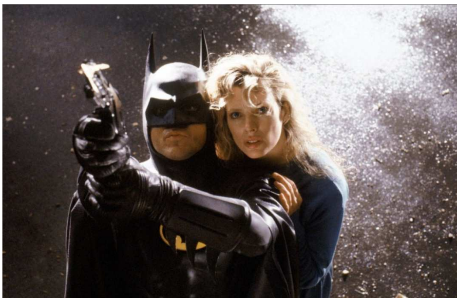
FIG. 5. Imagen promocional de Batman (Tim Burton, 1989).

Desde entonces hemos tenido seis películas más protagonizadas por la creación de Bob Kane y Bill Finger. Los tonos han variado: desde la asfixiante oscuridad gótica de Burton al hortera musical de Broadway propuesto por Joel Schumacher, para finalizar, por ahora, en los contornos policíacos y realistas de Christopher Nolan. Pero un mismo problema sigue perdurando: Batman cada vez lleva una armadura menos identificable pero, sin duda, más segura. Los ejecutivos de Hollywood lo tienen claro: no se pueden creer que un ser humano pueda luchar, con sus propias habilidades llevadas al límite, contra el crimen. Hay que ponerle protección, cuanto más pesada, mejor. Teniendo en cuenta esto, ¿están en buenas manos nuestros superhéroes favoritos?