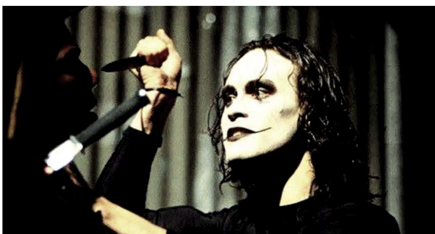
FIG. 11. Fotograma de El Cuervo (Alex Proyas, 1999).

real que le produciría la muerte. Sin que hubiera podido completar todas sus escenas, los productores echaron mano de la cada vez más desarrollada tecnología informática. Así, utilizando también a un doble, se pudo terminar el film a través de parches digitales como colocar la cara de Lee en la del doble o repetir un mismo movimiento en diferentes planos. De manera harto macabra, los efectos visuales digitales no solo salvaron a la película, sino que le añadieron un escalofriante elemento metalingüístico: al igual que su personaje, Brandon Lee volvía de la muerte para finalizar su obra.