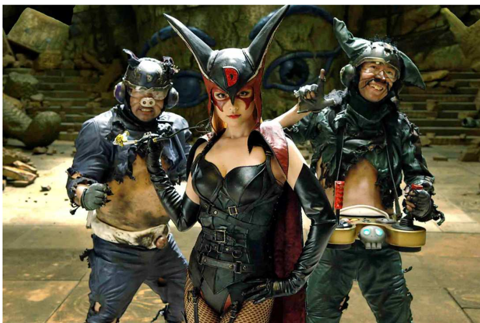
FIG. 9. Imagen promocional de Yatterman (Takashi Miike, 2009).

En el muy productivo cine de bajo presupuesto nipón directo a DVD (o, ahora, Blu-Ray) en su vertiente fantástica podemos apreciar la adopción de todo un universo formado por tópicos y arquetipos que son aceptados con naturalidad, regocijándose en su condición de tales. No hay más que fijarse en las desmedidas duraciones de casi todos los largometrajes cinematográficos que adaptan a un personaje o serie concreta, en ocasiones incluso dividiendo la acción en varias películas, con tal de procurar incluir todos los eventos originales en el metraje, con las menores variaciones posibles.