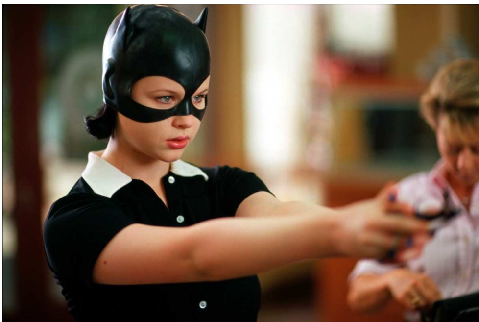
FIG. 13. Fotograma de Ghost World (Terry Zwigoff, 2001).

Mientras desde Time Warner / DC se rompen la cabeza en su intento por sacar adelante el proyecto de la JLA y Marvel / Walt Disney sigue adelante triunfante con su saga de Los Vengadores , en la televisión triunfa The Walking Dead y convence Arrow (2012-). Incluso en los círculos más selectos del cine de autor el cómic es protagonista: ahí tenemos la última Palma de Oro de Cannes o un director tan personal como David Cronenberg llevando a la pantalla Una historia de violencia . En estos momentos, el cine y el cómic parecen más unidos que nunca. La cuestión es, ¿hasta cuando? y ¿a qué precio?