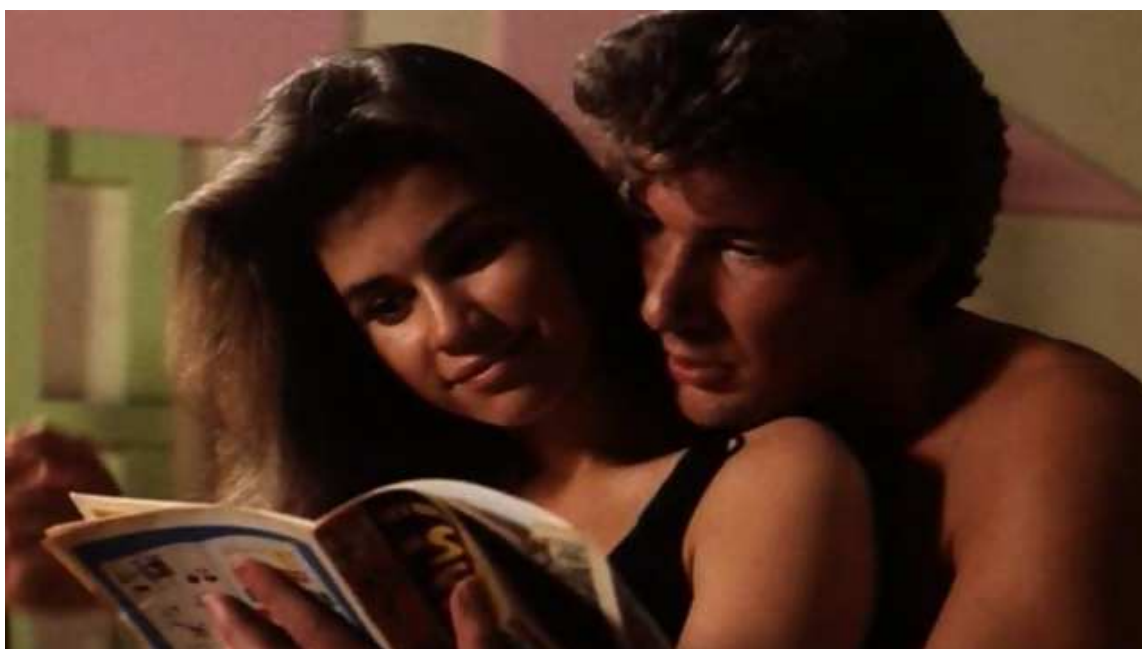
FIG. 8. Fotograma de Vivir sin aliento (Jim McBride, 1983).

Para finalizar, una auténtica curiosidad: solo en la desvergonzada década en los ochenta, en la que el cine perdió el respeto de todo y todos a la hora de realizar secuelas y remakes de clásicos hasta el momento intocables, podía ver la luz un remake norteamericano de Al final de la escapada ( À bout de souffle , 1960), la mítica ópera prima de Jean-Luc Godard, convertido de inmediato en abanderado de la Nouvelle Vague y padre putativo de la modernidad cinematográfica. Vivir sin aliento ( Breathless , Jim McBride, 1983) fue el delicioso resultado. Y en ella, un díscolo y entrañable Richard Gere, en plena forma física, se nos presentaba como un lector apasionado de las aventuras cósmicas de Estela Plateada, el cual representaba el torrente de puro poder romántico que movía a Gere. En un momento del film, este utilizaba uno de los cómics como naíf declaración de amor a su amada (una escena fusilada posteriormente por Tarantino, fan declarado de la película, en su guion para Amor a quemarropa ( True Romance , Tony Scott, 1993), en la que Christian Slater se declaraba a Patricia Arquette mediante un número de Spiderman ). En el universo imperfecto de Hollywood, Vivir sin aliento es la mejor adaptación posible de Estela Plateada que podemos tener.