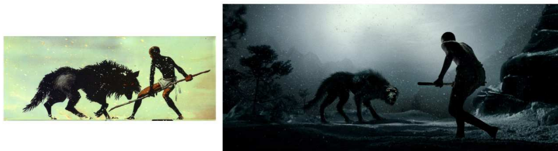
FIG. 10. Montaje comparativo entre el cómic 300 (Frank Miller, 1998) y la película homónima (Zack Snyder, 2006).

Veamos el ejemplo contrario partiendo de una base similar. La miniserie 300 , otro experimento narrativo de Miller a la hora de buscar el equivalente gráfico del esplendoroso formato scope de los viejos péplums, surgió del recuerdo que guardaba de la niñez del visionado de El león de Esparta ( The 300 Spartans ), dirigida por Rudolph Maté en 1962. Miller realizaba una versión hiperbólica de esa película en la cual el lacónico hilo argumental era compensado por una exaltación de la brutalidad y los aspectos más sangrientos de una guerra de ese tipo. A la hora de adaptar la obra, Zack Snyder no se pudo resistir a reproducir algunas de las viñetas más célebres del original, pero la obra final va más allá de la mera mimesis. La utilización de un escenario creado íntegramente con técnicas digitales aporta una atmósfera tenebrosa a la vez que subraya los elementos fantásticos de un título que en ningún momento se pretende una lección de historia. Por otro lado, recursos eminentemente cinematográficos como la cámara lenta o el plano secuencia dinamizan la energía de unas imágenes que antes de remitir al cómic original se nos presentan como una versión hiperbólica de los antiguos péplums.